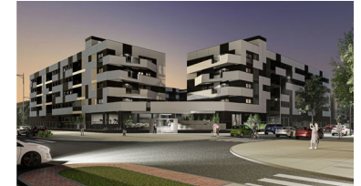
PORTAL 2 - Bajo A

Superficie Útil Total s/ Calif. Prov.: 76.27m 2